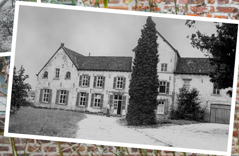
De oude hoeve werd in de zeventiende eeuw gebouwd.