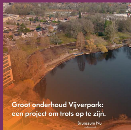
Groot onderhoud Vijverpark: een project om trots op te zijn.

Bekijk deze en andere stadsjournaals op www.brunssum.nl/stadsjournaal .