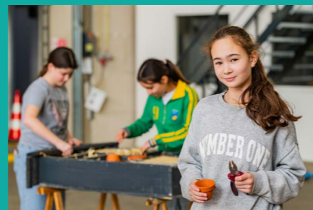
Samen bouwen aan een insectenhotel.