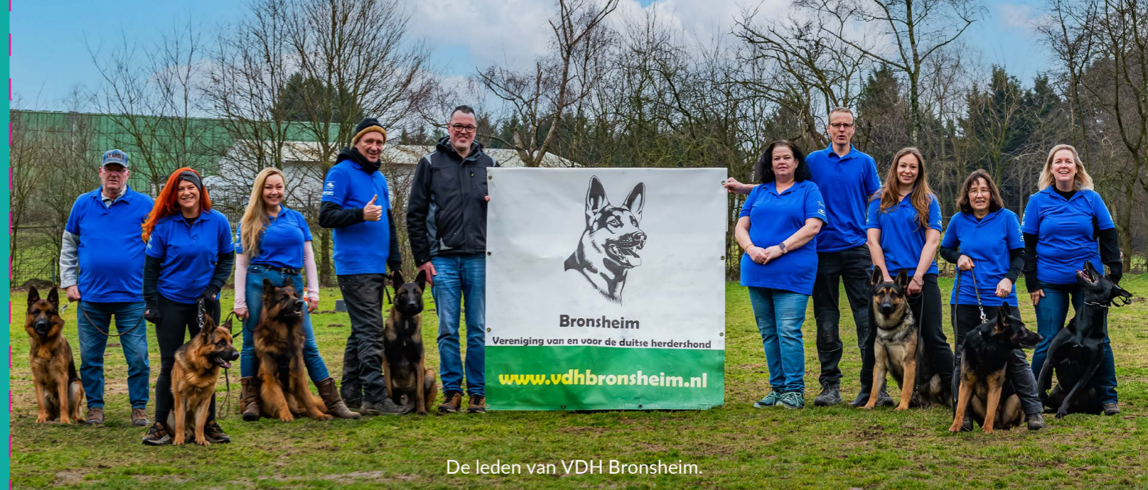
De leden van VDH Bronsheim.