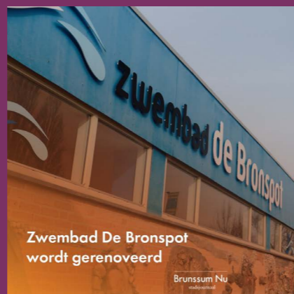
Zwembad De Bronspot wordt gerenoveerd