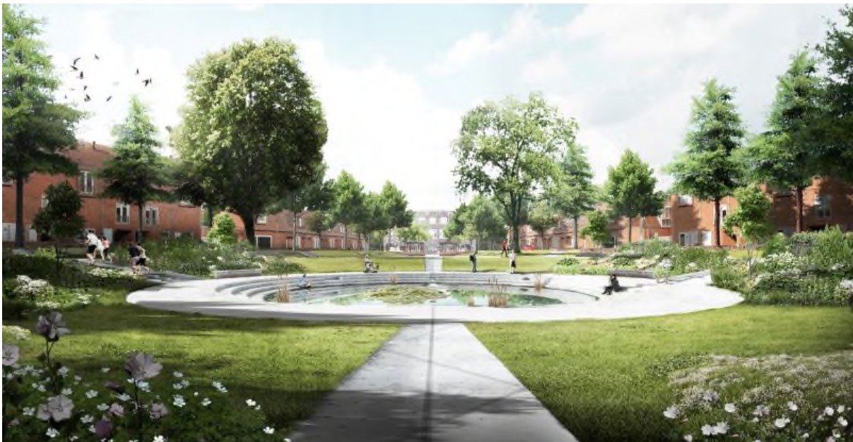
Sfeerimpressie van het nieuwe Treebeekplein (Ziegler | Branderhorst)